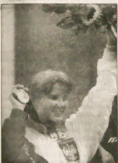
▲ Mistrzynie olimpijskie Renata Mauer-Różańska.