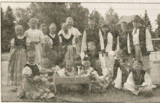
▲ „Skotniczka” pozie do zdjęcia.