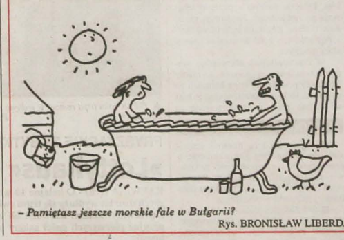
- Pamiętajsz jeszcze morskie fale w Bułgarii? Rys. BRONISŁAW LIBERDA

Higienicy powiatu frydecko-mistekkiego nie polecają kąpielii w zbiornikach wodnych na Baszce i Olesznej, wolny od bakterii, glonów i sinicy jest natomiast Zalew Zermanicki.