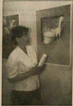
▲ W hawierzowskiej Galerii „Spirala” przebiega wystawa obrazów i grafik znanego czeskiego artysty Vladimira Komarka. Pełne poezji prace oglądać można już tylko do 12 czerwca br.

Nie sygnowane materiały publicystyczne i informacyjne pochodzą z satelitalnego serwisu informacyjnego Polskiej Agencji Prasowej.