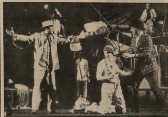
▲ «Sen nocy letniej» Williama Szekspira na deskach Sceny Polskiej TC. Premiera jutro o godz. 17.30.

„Samym Szekspirem można powiedzieć bardzo dużo, a ilu jest jeszcze zupełnie uśpionych mistrzów klasyki!” - powiedział w jednym z wywiadów zna-