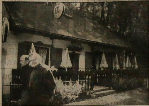
Tuż obok ruchliwego centrum Cieszyna, przycupnięta pod murami miasta, rozciąga się cieszynska Wenecja. Jak wszyscy nazywają ten zakątek. Tu przed wieloma laty mieszkali i mieli swoje warsztaty rzemieślnicze garbarze, ikarze i farbiarze. Przez lata malownicze budynki przy ulicy Przykopy przemieniały się w ruinę. Teraz wstąpił tu duch odbudowy. Choć inwestorzy są prywatni, a rekonstrukcje przebiegają pod nadzorem konserwatorskim, już widać pierwsze efekty - dwie malownicze restauracyjki, gdzie można ochłodzić się nie tylko zimnym napojem, ale i szmerem strumienia. Na remont domków cieszynskiej Wenecji miasto przyznało korzystne pożyczki - nawet do wysokości 25 tys. złotych. Na zdjęciach: Być może malownicze gospodki i młyn wodny wkrótce zaczną konkurować z atrakcjami ruchliwego centrum Cieszyna.

Nie sygnowane materiały publicystyczne i informacyjne pochodzą z satelitalnego serwisu informacyjnego Polskiej Agencji Prasowej.