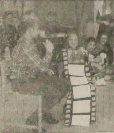
NASZ ADRES: Redakcja „Głosu Ludu”, P.O.Box 29, Novinářská 3, 709 29 Ostrava 1. UWAGA! Pisząc do nas, nie zapomnij podać swego adresu i napisać, ile masz lat!