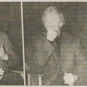
Daniel Olbrychski na spotkaniu w Bystrzycy.