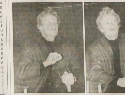
Daniel Olbrychski na spotkaniu w Bystrzycy.