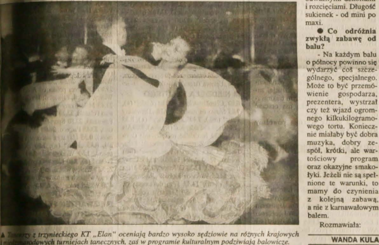
Tancerze z trzyńcieńskiej KT „Elan” oceniają bardzo wysoko sędziów na różnych krajowych i międzynarodowych turniejach tancecznych, zaś w programie kulturalnym podziwiają balowicze.