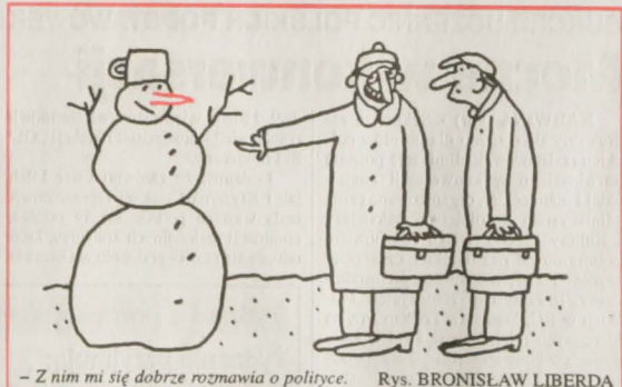
- Z nim mi się dobrze rozmawia o polityce. Rys. BRONISŁAW LIBERDA

NIEDZIELA - Zachmurzenie umiarkowane lub duże z opadami deszczu ze śniegiem lub deszczu, w górach - śniegu. Temperatura w dzień 1 - 5 st. (w poniedziałek do 7 st.), w nocy od -1 do 3 st. C.