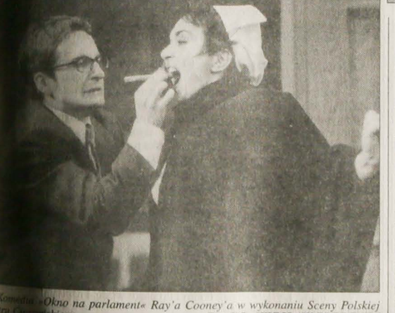
»Okno na parlament« Ray'a Cooney'a w wykonaniu Sceny Polskiej Teatru Cieszyńskiego.