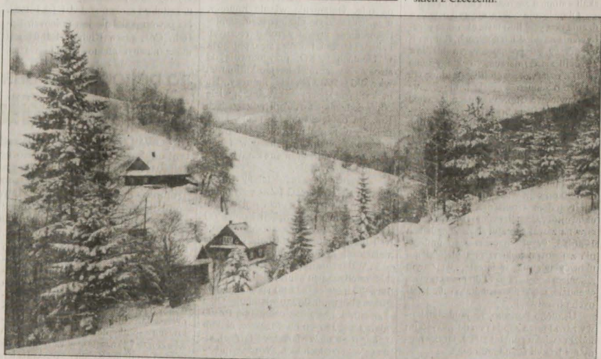
▲ Na Podbeskidziu nadal panują znakomite warunki narciarskie. Czynne są wyciągi narciarskie, zaś na wierzchołkach i zboczach idealne trasy dla miłośników sportów zimowych. Na zdjęciu: widok z górnej Przelacy na dolinę o tej samej nazwie i zbocze, na którym znajdują się wyciągi narciarskie.

Z uwagi na to, że od kilku lat przebiega w Hucie Trzyńskiej planowa redukcja etatów w głównej gałęzi produkcji, również rok miniony pod tym względem nie stanowił wyjątku. Podczas gdy na końcu 1998 roku na liście zatrudnionych figurowało tutaj 8695 osób, w rok później było ich już tylko 7021. Jak podała rzeczniczka prasowa Huty, Kateřina Samková, nie sposób