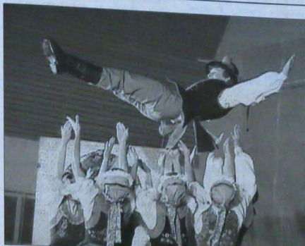
♦ W trakcie wieczornego koncertu galowego ZPIT „Śląsk” im. St. Hadyny widzowie podziwiali nie tylko stroje, choreografię i opracowanie muzyczne poszczególnych utworów, ale przede wszystkim piękne wykonanie pieśni - zarówno przez chór, jak i solistów - oraz lekkość, precyzję i brawurę tancerzy.

KARWINA (h) - W środę 3 października o godz. 17.00 otwarta została w Bibliotece Regionalnej w Karwinie wystawa na rynku Masaryka wydana przez "Polską książkę na Śląsku Cieszyńskim". Ekspozycja stanowi bliższą współpracę pomiędzy Biblioteką, Kongresem Polaków w RC i jego ośrodkiem dokumentacji oraz sekcją historii regionu Zarządu Głównego PZKO. Na wystawie obejrzyć będzie można oryginalny lub reprodukcje polskich książek napisanych przez cieszyńskich lub dla cieszyńskich ze szczególnym uwzględnieniem poezji wydrukowanej w miejscowych drukarniach i wydanych przez miejscowe wydawnictwa. Ekspozycja, pochodząca z prywatnych zbiorów oraz ze zbiorów karwińskiej Biblioteki Regionalnej, podzielona na naukowe i popularnonaukowe, jubileuszowe i lokalnościowe, literackie, religijno-kościelne, podręczniki, sprawnictwa i statuty (najstarszą zachowaną polską książką, napisaną na Śląsku Cieszyńskim, jest wydana w Brzegu w 1716 roku książeczka Jana Muthmanna pt. "Wierność Bogu i cesarzowi..."). Odbity fragment wystawy poświęcony będzie drukarniom i ośrodkom wydawniczym (m.in. zjedzia, rakławki). W będzie natomiast na wystawie gazety, czasopiśmi, kalendarzy ani ulotki. Autorem scenariusza wystawy jest Stanisław Zahradnik. Ekspozycja oglądana będzie do 31 października.