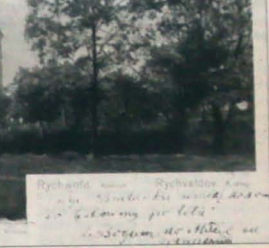
▲ Jedną z najstarszych pocztówek (początek XX wieku) z Rychwałdu z kościołem katolickim pw. św. Anny z 1595 r.