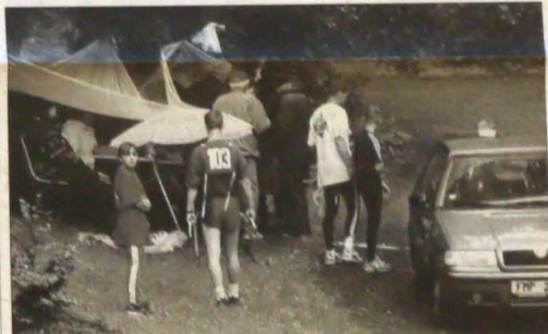
Uczestnicy Festynu Górskiego w Koszarzyskach po biegu pod górę.

Premier Zeman mimo demonstracyjnie „niezdrowego trybu życia” należy do polityków cieszących się dobrym zdrowiem. Bardzo rzadko zapada na przeziębienia czy grypy. Jak powiedział w jednym z wywiadów, spowodowane jest to tym, że unika uprawiania sportów, które mogłyby mu wywrządzić jakąkolwiek krzywdę.