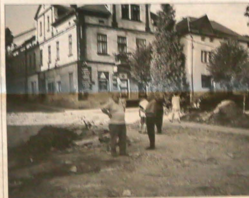
▲ Jedna z ulic w Makowie Podhalaniskim. Księża przeszła fala powodzianowa.

▲ Wykopy przed główną bramą PSP w Olbrachcicach. Ciekawo, czy to naprowdę ostatni już zabieg osuszenia fundamentów tego budynku?