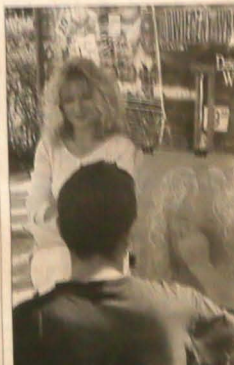
▲ Jeszcze tylko portret i można wrócić z wakacji. Od poniedziałku - nowy rok szkolny.

Podczas tegorocznych wakacji udało się członkom Stowarzyszenia obić dwie zewnętrzne ściany budynku drewnem, teraz przyszła kolej na trzecią. Do końca roku miałyby wreszcie całe schronisko od zewnątrz wyglądać tak, jak przed pożarem. „Na szczęście nie musimy w tym roku za dużo inwestować - materiał mamy swój, a większość naszych członków ponownie pracuje na Skalce w czynnie społecznym” - dodał A. Martynek.