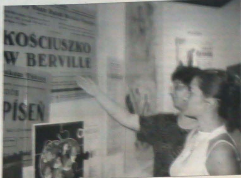
▲ Na wystawie poświęconej historii plakatu w Państwowym Archiwum Dawnych w Karwinie zainicjował m. in. plakat zapraszający na przedstawienie sztuki „Kosciuszko w Berville” w Teatrze Cieszyńskim. Spokój ten - wykonany przez Państwową Pracownię Plakatu w Katowicach - ukazał się w 1951 r.