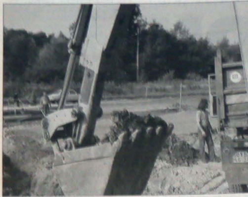
Sarkają nieco kierownicy zdążający z Karwiny-Kapalni do Ostrowy lub Hawierzowa, gdyż rozdzielnie szos prowadzących do tych miast zamienilo się w plac budowy. Chwilowe utrudnienia w ruchu kołowym wywoła jednak efekt końcowy podjętych prac - skrzyżowanie zastąpi tu nowe rondo. A jak twierdzi eksperci, na rondo dacharza się mniej wypadków niż na skrzyżowaniach, są więc bezpieczniejsze. Na odcinku od ronda do dawnego szybu „Henryk” Kapalni „CSA” podniesiona zostanie zapadająca się droga.