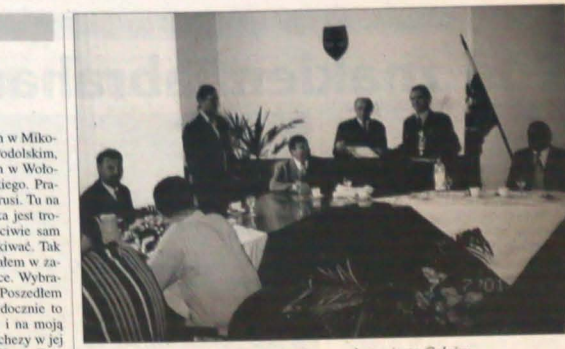
Górnosuski strażaków przyjmuje prezydent miasta Gelnicy.

Polacy z południa Ukrainy zaczynają ponownie rozmawiać po polsku. Patrząc na odrodzenie ich języka narodowego, ukraiński sąsiedzi także zaczynają się zastanawiać nad potrzebą nauki swego języka. Duża bowiem część Ukrainy mówi praktycznie wyłącznie po rosyjsku. Pytanie o powrót własnego języka uczniom, czyli o renesans języka ukraińskiego, zaczęła coraz częściej pojawiać się w życiu tamtejszych kregach. Tekst i zdjęcia: LESZEK WĄTROBSKI