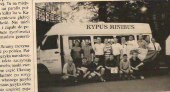
Pamiątkowe zdjęcie górnosuskich drużyn strażackich w Gelnicy.

„Utrzymywanie stosunków partnerskich wiąże się z pewnymi kosztami. Czy Suchoj Górna stać na to, żeby z przedstawicielami zaprzyjaźnionych miejscowości składać sobie kurtuazyjne wizyty? „Wstępny kontakt na szczeblu rad poszczególnych gmin nie powinien uniknąć. Trzeba bowiem ustalić kierunki współpracy, przedstawić swoje wizje i oczekiwania. To na szczęście mamy już za sobą. Obecnie zaś - o czym świadczy wspomniana przeze mnie wspólna impreza - jesteśmy już na etapie konkretnych przedsięwzięć. A co do kosztów, w tym roku po raz pierwszy wyasygnowaliśmy w budżecie niewielką sumę na tzw. stosunki partnerskie. Liczymy ponadto na fundusze europejskie. Wiadomo przecież, że nasze kontakty z Polską i Słowacją nie mogą odbywać się kosztem innych, dla mieszkańców ważniejszych spraw”.