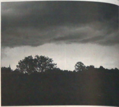
Sierpniowe burze nad trzynieckim oświedlem Sosna.

OLBRACHCICE (s) - Zgodnie z postulatami karwińskiej stacji sanitarnej-epidemiologicznej, w budynku czeskiej szkoły podczas wakacji przeprowadzono gruntowną rekonstrukcję sieci wodociągowej. Wszystkie umywalki wyposażono w tzw. bezkontaktowe baterie wodociągowe, które dozują i automatycznie mieszają we wspólnym strumieniu ciepłą i zimną wodę. Ma to dać nie tylko oszczędności w zużyciu wody, ale także zminimalizować niebezpieczeństwo epidemii chorób zakaźnych. Instalacja takiego sprzętu w szkolnych sanitariatach i stołówkach jest jednym z wymogów Unii Europejskiej.