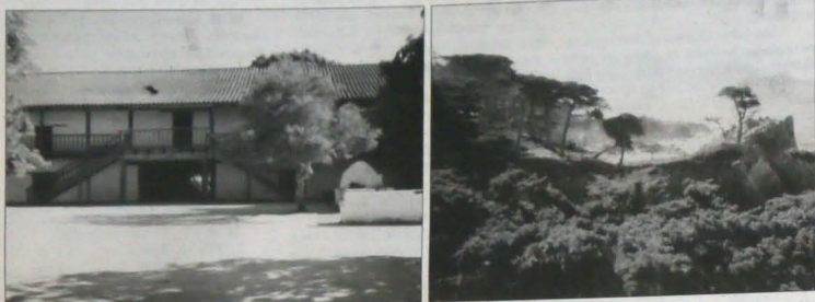
▲ Plac centralny w Sonomie jako żywo przypomina scenę z serialu o Zorro. Wybrzeże kalifornijskie to nie tylko uspaniałe plaże, ale także skaliste urwiska i drzewa jak wyrzeźbione przez wiatr.