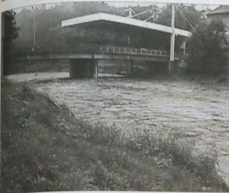
A. Koryto rzeki Olzy w Czeskim Cieszynie na odcinku między przejściami granicz- nymi.