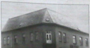
W tym budynku MK PKZO w Skrzeczoniu ma swoją siedzibę od 1954 roku. W 19 lat później Kolo kupiło cały dom na własność. Adaptacja, remonty i modernizacja lokali pochłonęły już tysiące godzin pracujących przez miejscowych PKZO-owców w czynie społecznym...