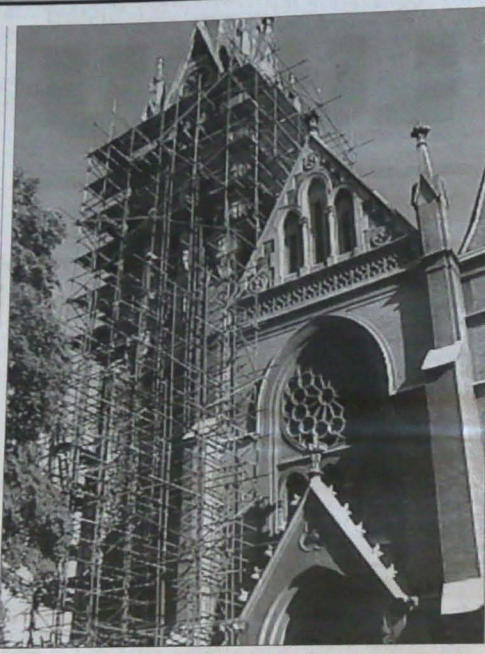
Okolona rusztowaniami wieża kościoła parafialnego pw. Serca Jezusowego w Cz. Cieszyńskie.