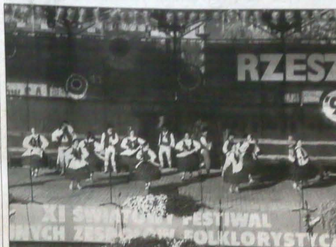
Zespół Pieśni i Tańca ZG PZKO „Olza” występował nie tylko na Światowym Festiwalu Polonijnych Zespołów Folklorystycznych w Rzeszowie (tu górną część), czy na Góraliskim Świątku w Jabłonkowie (tu dolną część), ale pod koniec lat 90. miał okazję zaprezentować się też w USA (tu doła z lewej).

Niedawno ukazała się wasza najnowsza płyta koncertowa „Goodbye”. A co z nową propozycją studyjną?