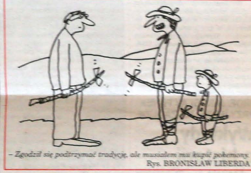
Zgodził się podtrzymać tradycję, ale musiałem mu kupić polemomy. Rys. BRONISŁAW LIBERDA

Jednocześnie dziesięcioro jego członków rozdzieli pomiędzy sobą poszczególne funkcje.