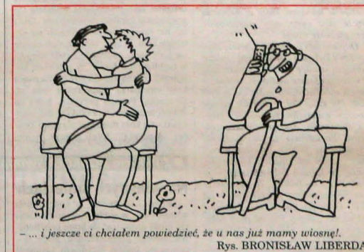
i jeszcze ci chciałem powiedzieć, że u nas już mamy wiosnę!