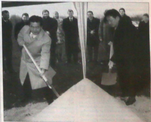
▲ Uroczysty wykop pod fundamenty hali produkcyjnej firmy „Shimano” na karwińskim Nowym Polu.

Oczywiście, to jeden z naszych najbliższych celów. Musimy poznać się wzajemnie, rozmawiać ze sobą, budować pomost zaufania. Zaproszono nas na, na zebranie Asocjacji Stowarzyszeń Mniejszości Narodowych. Było to jedno z cennych doświadczeń. Z niecierpliwością czekamy też na ustawę o prawach mniejszości narodowych, bo na niej można będzie się oprzeć. Dobra ustawa o mniejszościach jest potrzebna zarówno społeczeństwu większościowemu, jak i poszczególnym grupom narodowym. (h)