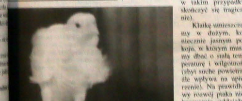
KLĘCZAK Z MIODEM

W tej samej chwili lekki szmer dobiegł do jego uszu. Naprzeciw niego stał młody człowiek, w którym młody mężczyzna rozpoznał swojego brata. W tej samej chwili lekki szmer dobiegł do jego uszu.