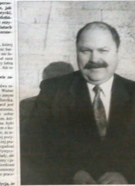
Teatr Cieszyński... Teatr Cieszyński...