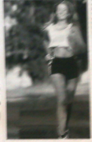
Portrait of a woman, likely related to the 'DOBRA PADA' article.