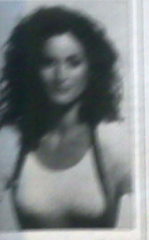
Portrait of a woman, likely related to the 'Dziewczyna z nad O' article.