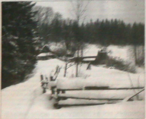
Obłędny zmy. Przystąpił do obrony... Obłędny zmy. Przystąpił do obrony...