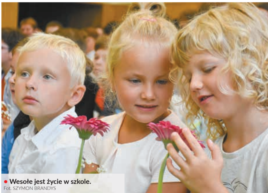
• Wesołe jest życie w szkole.

Wczoraj edukację w błędowickiej podstawówce rozpoczęło sześćdziesięciu nowych uczniów – pięćdziesięciu w klasie pierwszej oraz jeden w klasie szóstej. Starsi uczniowie przygotowali krótki program artystyczny, dziewięćdziesięciu pierwszoklasistów powitali ich kwiatkiem. Na pierwszoklasistów czekały jednak