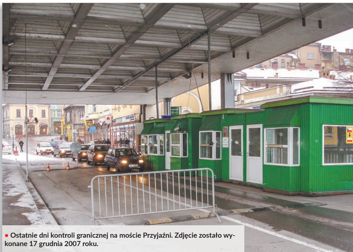
• Ostatnie dni kontroli granicznej na moście Przyjaźni. Zdjęcie zostało wykonane 17 grudnia 2007 roku.