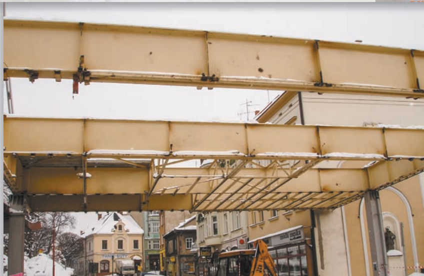
• Demontaż „granicy”. Most Przyjaźni...