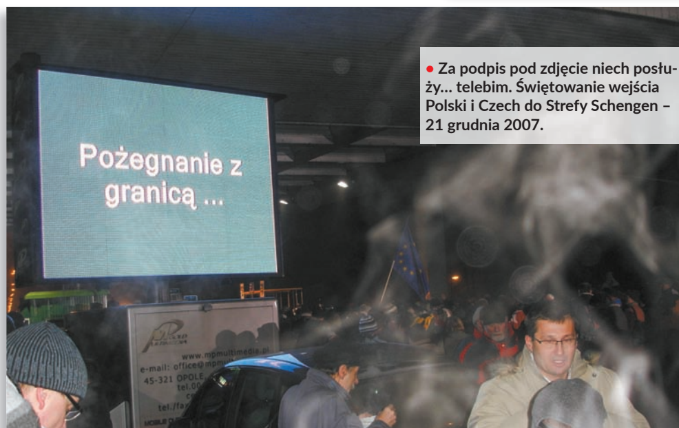
• Za podpis pod zdjęcie niech posłuży... telebim. Świątowanie wejścia Polski i Czech do Strefy Schengen – 21 grudnia 2007.