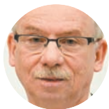
Janusz Lewandowski europoseł

2019 to najważniejszy rok wyborczy, odkąd Polska jest w stanie kształtować suwerennie swój los. Te wybory rozstrzygną o tym, jaka będzie przyszła Unia Europejska i jakie będzie miejsce Polski w niej