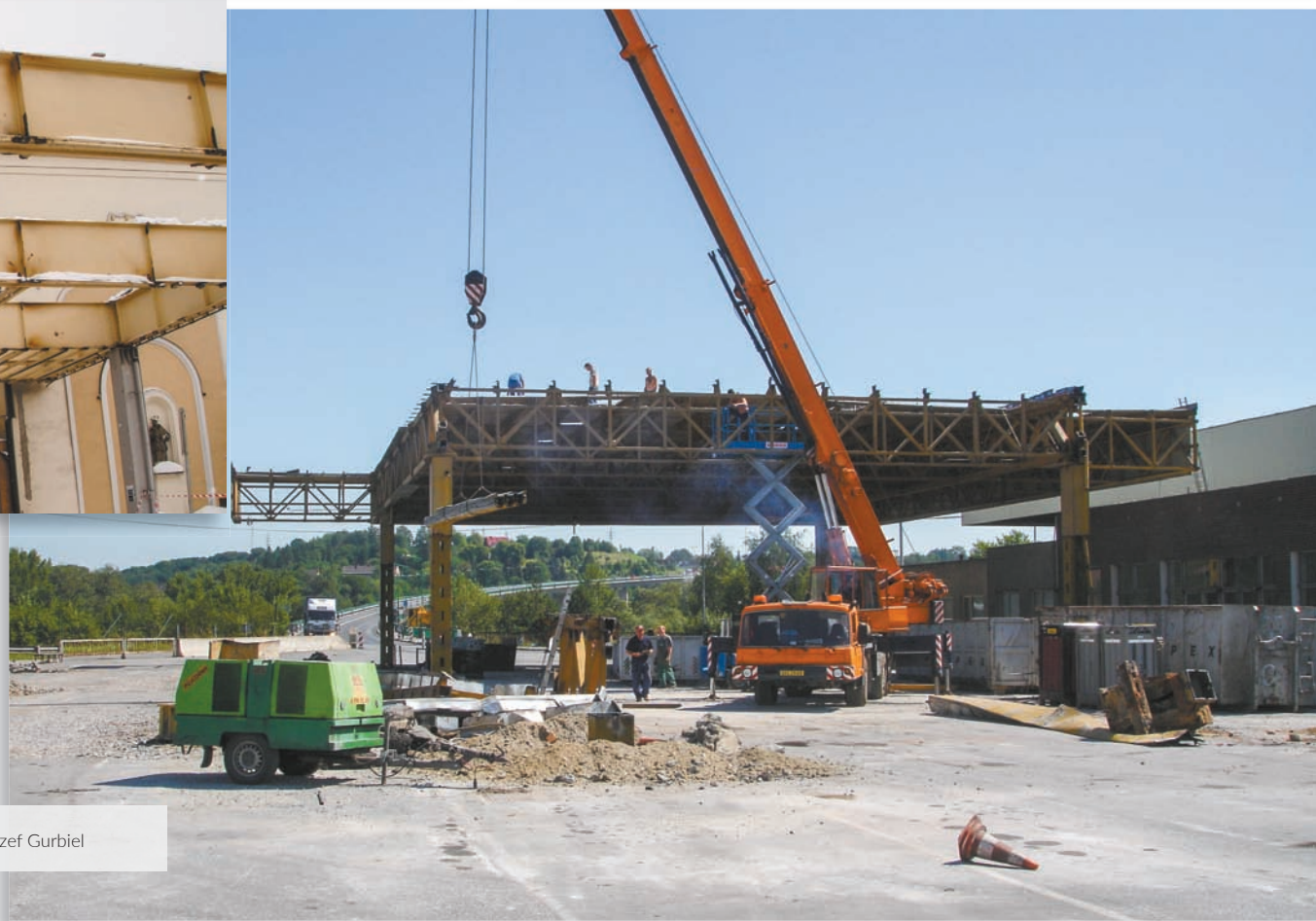
• ...oraz Kocobędz.