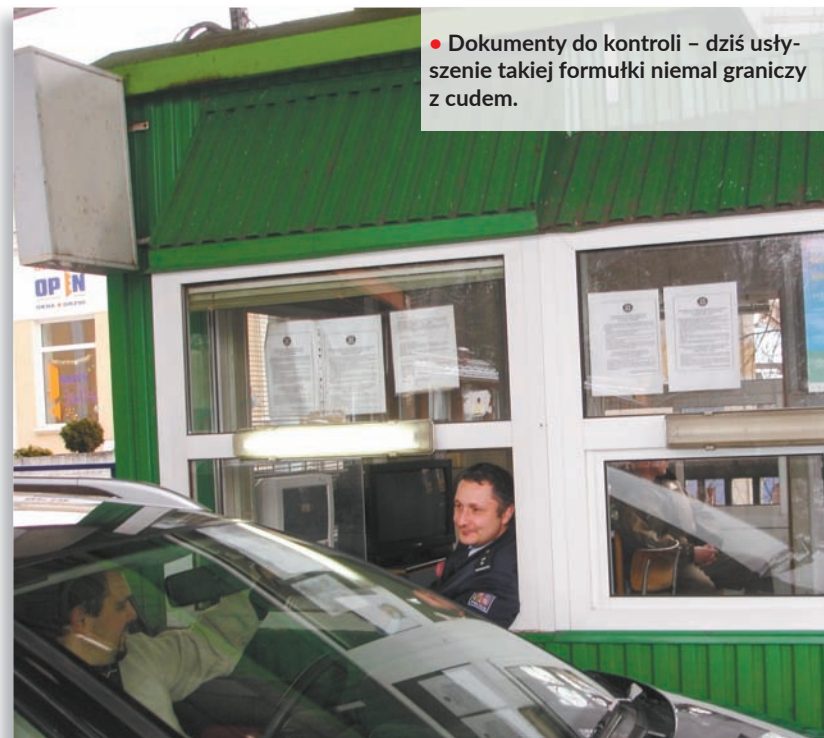
• Dokumenty do kontroli – dziś usłyszenie takiej formułki niemal graniczy z cudem.