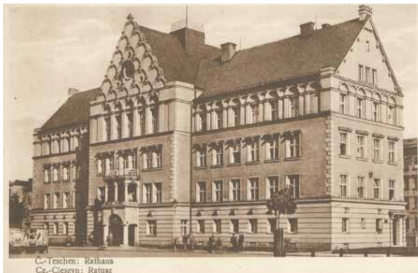
Cieszyn: Ratusz Cz.-Cieszyn: Ratusz