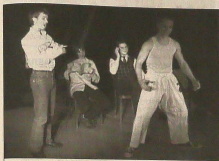
▲ Nydeczanie przedstawili parodię telewizyjnej „Randki w ciemno”. ◆ W trakcie dyskusji po spektaklu.