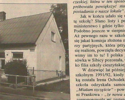
▲ Szkoła polska w Sibicy w roku szkolnym 2002/03. W dwóch lokalach klasowych uczy się tu 26 dzieci.