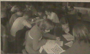
▲ Zwycięska drużyna podczas rozwiązywania krzyżówki.

ORŁOWA (s) - Międzynarodowy turniej amatorów rozwiązywania rozrywek umysłowych, którego trzecie wydanie odbyło się w piątek w orłowskim pałacu ślubów jako impreza towarzysząca VII Wystawie Klubów i Organizacji Społecznych działających na terenie Orłowej, zakończył się bezapelacyjnym zwycięstwem reprezentacji Gimnazjum Polskiego w Karwinie.