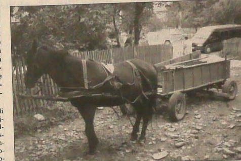
Furmanka, obok Dacii kolejny charakterystyczny pojazd na rumuńskich drogach. Suceava = Suczawa. Nowoczesne centrum administracyjne. Bukowińska Czystochowa = sanktuarium maryjne w miejscowości Kaczyka.