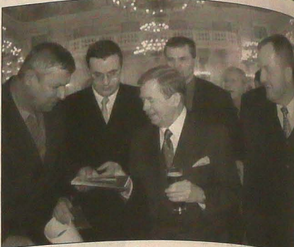
Prezydent RC Vaclav Havel przyjął w środę w Sali Hiszpańskiej...