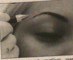
▲ 3. Makijaż trwały umożliwiła „zageszczenie” zbyt rzadkich brwi. Po takim zabiegu wyglądają naprawdę bardzo naturalnie.