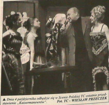
Dnia 4 października odbędzie się w Scenie Polskiej TC ostatnie przedstawienie „Kaisermanewry”.