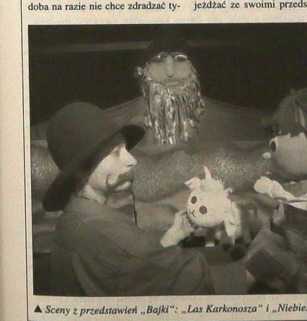
▲ Sceny z przedstawień »Bajki«, »Las Karkonosza« i »Niebieski Pietrek«.