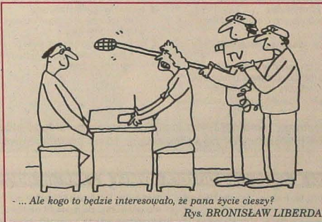
Ale kogo to będzie interesowało, że pana życie cieszy?

OSTRAWA (mro) - Leszek Miller, premier rządu RP, 13 czerwca br. przybędzie do Ostrawy. Program jego jednodniowej wizyty przewiduje m.in. spotkanie z przedstawicielami polskiej mniejszości narodowej.