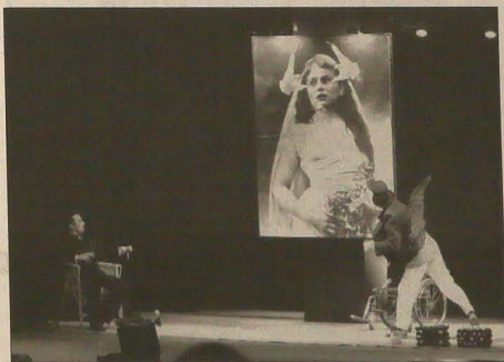
▲ Scena ze zwycięskiego spektaklu „Mewa” według A. P. Czechowa, wystawionego przez Teatr Klicperzy z Hradca Kralowej.

PRAGA / TRZYNIEC (db) - Piśmenna oferta zawierająca wniosek rozwiazania problemów czeskiego hutnictwa złożyli w ub. tygodniu przedstawiciele grupy Huta Trzyniecka S.A. oraz Commercial Metals z USA w rządowej międzyresortowej komisji ds. restrukturyzacji hutnictwa. Jak dowiedzieliśmy się od rzeczniczki prasowej trzynieckiego kombinatu metalurgicznego Dušany Fridrichowej, dokument mówi o gotowości wymienionych firm do okupienia udziałów skarbu państwa w ostarskich spółkach hutniczych Nowa Huta i Witkowiec. Inwestorzy są również przygotowani do równoległego wyłożenia środków gwarantujących funkcjonowanie zakładów, które zamierzają przejąć. W projekcie pamiętano też o wierzycielach ostarskich hut, z którymi inwestorzy zamierzają osiągnąć ugodę w sprawie zadłużenia i jego spłat, oraz o potrzebie osiągnięcia porozumienia w sferze socjalnej z reprezentacją pracowników.