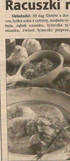
Kolumnę przygotowała: WANDA KULA