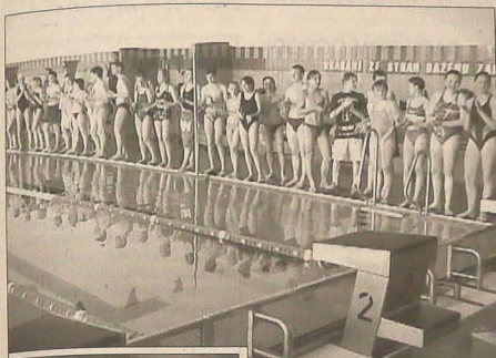
▲ Reprezentanci szkół podczas inauguracji I Mistrzostw Polskich Szkół Podstawowych w Pływaniu.