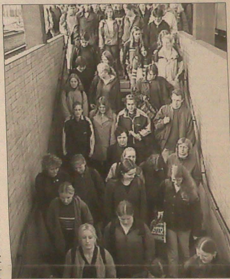
▲ Do Cz. Cieszyna w ciągu roku szkolnego zjeżdżają rano pociągami i autobusami z całego regionu setki uczniów szkół ponadpodstawowych. W poniedziałek dołączą do nich również dziewiątoklasiści, którzy przysiadą na egzaminy wstępne do szkół średnich.