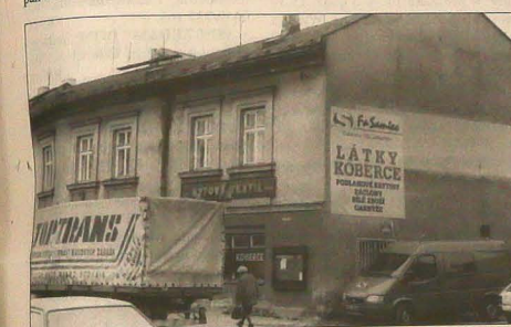
W tej kamienicy u wylotu Jabłonkowskiego rynku mieści się sklep tekstylnej firmy „Samiec”...