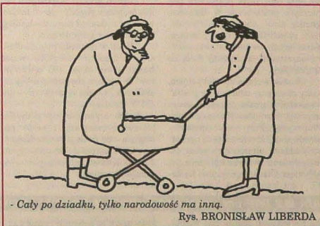
- Cały po dziadku, tylko narodowość ma inną. Rys. BRONISŁAW LIBERDA