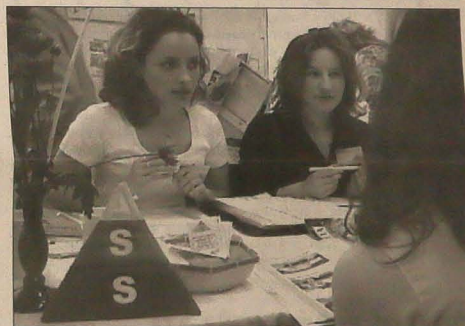
▲ Uczennice czesko-cieszyńskiej Akademii Handlowej w stoisku swojej firmy - Akademickiej Budowlanej Kasy Oszczędności.

rowali udział w warsztatach ekonomicznych i co za tym idzie - pomoc i poradnictwo PZKO-wcom zajmującym się sprawami gospodarczymi Związku), sposób realizacji ewentualnych zobowiązań i spełnianie złożonych obietnic to sprawa druga. Ostrożny optymizm jest jednak jak najbardziej na miejscu. „To dopiero początek bliższych kontaktów z zaolziańskim biznesem” - powiedział Z. Stopa naszej redakcji po zakończeniu spotkania. „Uważam, że korzyści mogą być obopólne. Oby takich ludzi, jak ci, z którymi spotkaliśmy się na forum przedsiębiorców, było jak najwięcej”.