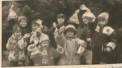
Dzieci z przedszkola w Orłowej-Lutyńce ze swoją „zajęczkową” zdobyczką.