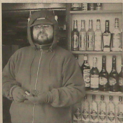
▲ „Kuch w interesie trawa, a sabinianie obrótów jest typowe dla okresu po świętach i Sylwestrze” - mówi sprzedawca alkoholu w Jastrzębiu.