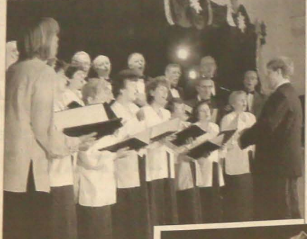
Chór mieszany 'Harfa' z chórkiem dzieci z okazji koncertu...