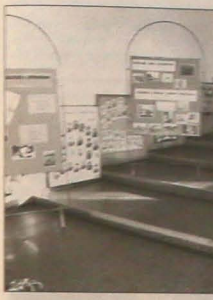
Wystawa prezentująca historię jabłonkowskiej placówki czyżby z uczniem zwiadowczym.