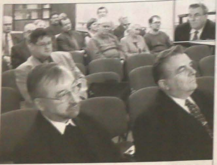
Głosem adwentowego spotkania Stowarzyszenia Intelencji Ch...