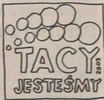
- Z tytułu na plakacie wynika, że to nie będzie impreza rozrywkowa. Rys. BRONISŁAW LIBERDA

Wystawa została umieszczona w foyer muzeum. Oglądać ją będzie można aż do połowy stycznia. Równoległe z wystawą szopkę wykonanych przez uczniów szkół podstawowych odwiedzających mogą podziwiać wystawę szopek, które dotarły do Trzyńca z Przybrania.