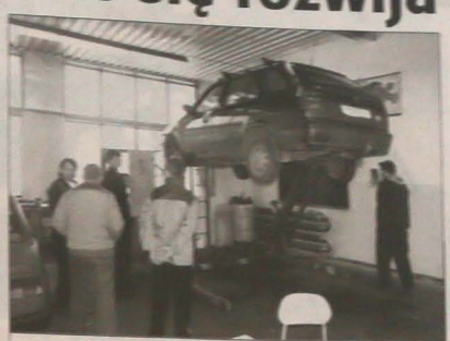
W „Dniu otwartych drzwi” szkoła oferowała darmowy przegląd samochodów.

Wielki skóń, które zapraszały umęczonego dzierwiakami i ich rodzinom na „Dzień otwartych drzwi” nie zabrakło Zastępcy Szkoły Średniej (ZSS) w Jabłonkowie.