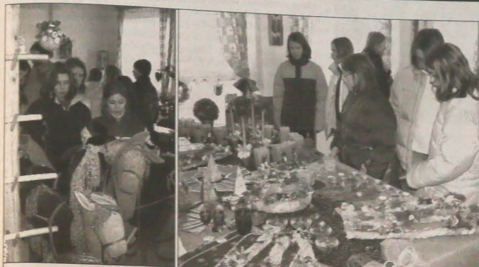
▲ Dekoracje świąteczne, świece czy pluszowe „lajkoniki” wzbudziły w środę i czwartek podziw dzieci i dorosłych zwiedzających wystawę prac klientów warsztatów św. Józefa Jabłonkowskiego Caritasu. Niepełnosprawna młodzież z Podbeskidzia korzysta z pomocy Caritasu już 3. rok.