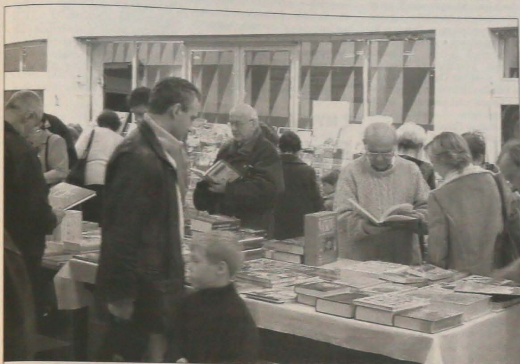
▲ Wystawa Polskiej Książki cieszy się tradycyjnie wśród Zaoziaków dużym zainteresowaniem.