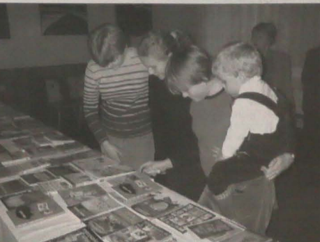
◆ W ramach obchodów 100-lecia byłego budynku szkolnego oraz 55-lecia koła PZKO przygotowano w Gutach m.in. wystawę zdjęć dokumentujących ważniejsze wydarzenia z historii miejscowej polskiej szkoły oraz MK PZKO. Sobotnia uroczystość była też okazją do nabycia polskich książek.

Wśród 40 wystawców nie zabrakło pezetkaowców. Ekspozycję MK PZKO w Orłowej Lutyni zdłomnowyła pamiętki - nagrody, dyplomy i upominki - z wojaży artystycznych