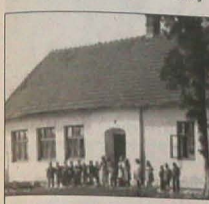
▲ Pierwsza polska szkoła „Na Kolonii” Gnojnik nr 53 (rok 1853).

Wielu gości z bliska i z daleka zjechało w ub. piątek do Polskiej Szkoły Podstawowej w Gnojniku, by uczcić 150-lecie szkolnictwa w tej miejscowości, przypomnieć historię szkoły „Na Kolonii”, o której wszystko się zaczęło, a w której