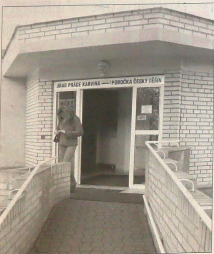
▲ Umowa „na stałe” albo na... bruk.