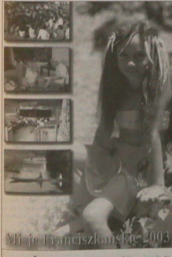
Misje franciszkańskie 2003