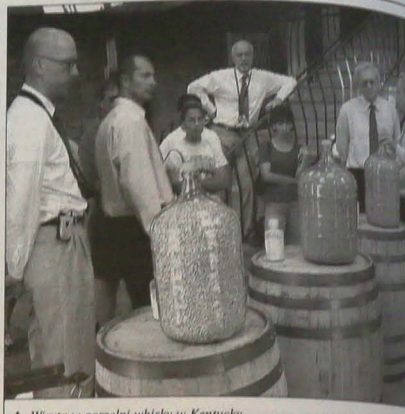
Wizyta w gorzelnii whisky w Kentucky