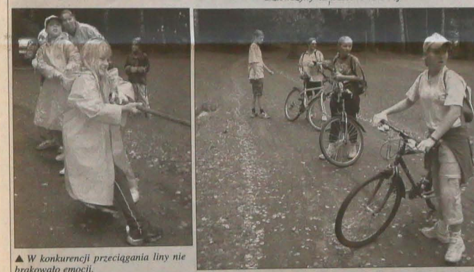
W konkurencji przeciągania liny nie brakowało emocji.