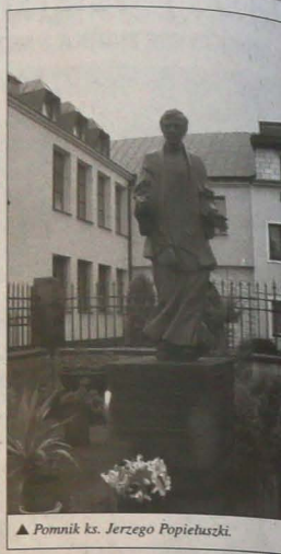
▲ Pomnik ks. Jerzego Popiełuszki.

Obecnie każdego letniego miesiąca do grobu ks. Jerzego przybywa około 30 000 pielgrzymów i turystów, w tym połowa w grupach zorganizowanych. Przybywają do miejsca, które upamiętnia czas walki o wolność Polaków oraz solidarności ich serc i umysłów.