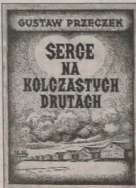
Projekt okładki: Paweł Zabystrzana

● W wieku 101 lat zmarła kontrowersyjna, choć niezwykle utalentowana reżyser Leni Riefenstahl , autorka słynnego Triumfu woli , która całą swą sztukę oddała w służbę hitleryzmu. ● W tym miesiącu pojawił się w księgarniach w Polsce pierwsza opracowana przez polskich autorów encyklopedia kina , zawierająca 5300 haseł, 2000 sylwetek reżyserów, 2650 sylwetek aktorów i twórców filmu. ● Do trwającej dyskusji o lokalizacji Centrum Wypędzonych w Berlinie włączył się „Sala” (dodatek literacki „Przwa”), publikując w nr. 335 wywiad K. Burnetki i J. Makowskiego z reżysera Dariusza Gałuski . W oczach jurorów przepadła natomiast Pomnik , nakręcona przez Jana Jakuba Koloskiego na podstawie powieści Witolda Gombrowicza . Swoją nagrodę przyznała jej publiczność.