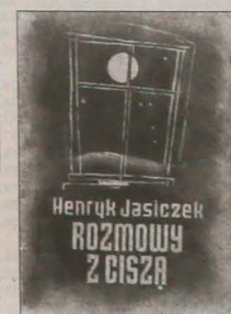
Projekt okładki: Franciszek Świder

nie problematyką własnego regionu, pasją wernego sportretowania, nakreślenia wizerunku artystycznego ziemi rodzinnej i jej ludzi może jedynie ocalić szanse naszej rodzimej literatury!