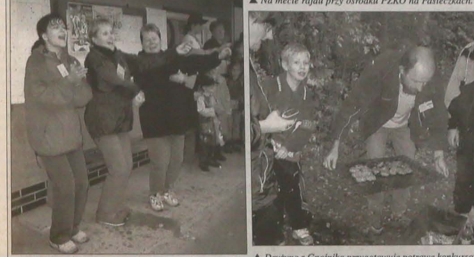
Panie z Wędryni prezentują swój program artystyczny.