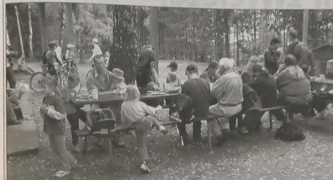
Na mecie rajdu przy ośrodku PZKO na Pasieczkach.