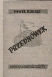
Projekt okładki: Władysław Stańczykowski

Twórczość autorów zgrupowanych wokół SLA nie wychodzi wycią poza opłoki prowincjonalnego świata. Jest wciąż dużo szumu, przetawian, dysput nad ruszowaniami organizacyjnymi, nabierania sił, rozpędu i przedreptywania w miejscu. Od czasu do czasu pojawia się jakieś opowiadanie, wiersz, nowelka, próba sztuki scenicznego. Ale to wszystko, poza nielicznymi wyjątkami, jest jakiejś nijakiej, anemicznej i to zarówno pod względem formy, jak i treści. Wiersze i opowiadania, jakie u nas powstają, mogłyby tak samo powstać w Rzeszowie, Debrecznie czy Frankfurcie. Utwory te są odrębnymi, pozbawionymi klimatu własnego środowiska, realiów tego środowiska i jego specyfiki. Autorzy nasi, bojąc się zarzutów amatorszczyzny, regionalizmu i provin-