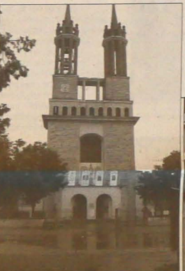
▲ Kościół parafialny pw. św. Stanisława Kostki na warszawskim Żoliborzu. W Miejsce spoczynku ks. Jerzego Popiełuszki z nagrobkiem w kształcie różańca z granitowym krzyżem.

Nieustannie też wysyłało pisma urzędowe do hierarchów kościoła z zarzutami, że kazania głoszone w kościele św. Stanisława Kostki