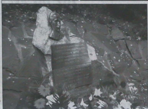
▲ Wśród gości uroczystości Witosowskich był przewodniczący Senatu RC, Petr Pithart.