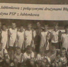
▲ Zwycięzca drużyna PSP z Jabłonkowa

Nigdy nie dorównamy wizji, która przychodzi do nas. Józef Czapski