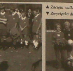
▲ Zacięta walka Jabłonkowa z połączonymi drużynami Błędowic i Sucheń Górnol.