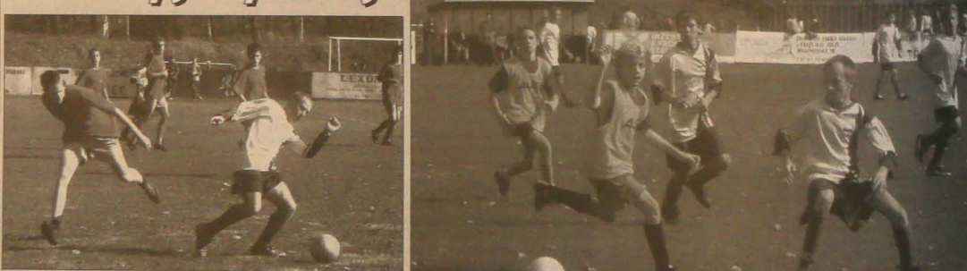
▲ W pierwszym meczu Jabłonków pokonał Trzciniec 5:2.