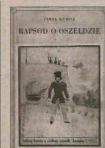
Projekt okładki: Franciszek Świder