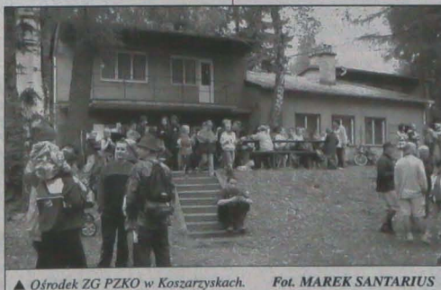
▲ Ośrodek ZG PZKO w Koszarzyskach.