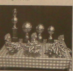
▲ Puchary i medale dla trzech najlepszych drużyn.