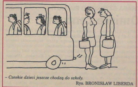
- Czeskie dzieci jeszcze chodzą do szkoły.