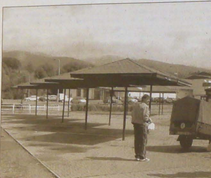
Opuszczyli w Jablonkowie kioski na placu przy skrzyżowaniu ulic Bukowieckiej i Dworcowej...