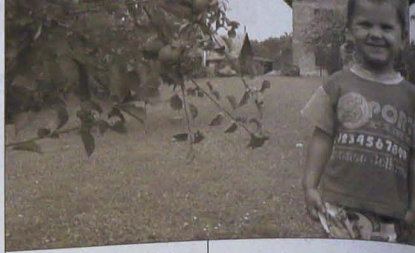
Amatorscy sadownicy mogą również pochwalić się dobrymi zbiorami jabłek i gruszek. W zimie więc dzieci będą mogły uzupełniać witaminy.