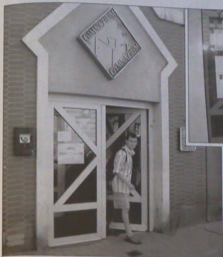
▲ Szkoły, które przystępują do strajku, mają obowiązek poinformowania o tym fakcie. W związku z tym już wczoraj na drzwiach Gimnazjum Polskiego oraz PSP w Cz. Cieszyne pojawiły się napisy „Strajk”.