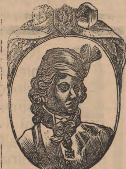
Naczelnik Tadeusz Kościuszko. Bit się o wolność Stanów Zjednoczonych i o utrzymanie niepodległości Polski.

Bohater dwóch światów. Naczelnik Tadeusz Kościuszko. Bit się o wolność Stanów Zjednoczonych i o utrzymanie niepodległości Polski. Mądra Konstytucja 3-go Maja i czyn zbrojny Kościuski, krew przelana na polach Racławic i Maciejowic, podtrzymały ducha w narodzie polskim, dały mu chrzest na przetrzymanie półtora-wiekowej niewoli.