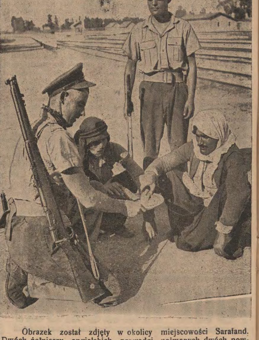
Obrazek został zdjęty w okolicy miejscowości Sarafand. Dwóch żołnierzy angielskich prowadzi pojmanych dwóch powstańców arabskich. Przystanęli w drodze, aby odpocząć i pożywić się — i dzielą się swymi zakąskami z wygłodniałymi Arabami.

becna była także p. Marszałkowa Piłsudska. Trumnę wynieśli na ramionach najbliżsi przyjaciele zmarłego: b. marsz. Pystor, b. premier Jędrzejewicz, b. min. Matuzewski, b. vi emarsz. Podoski, b. marsz. Switalski, gen. Zeligowski, b. pr. Kozłowski i b. p.s. Arciszewski. Kondukt otwierały sztabary młodzieży szkolnej, organizacji i zwiazków b. wojskowych, PPS, dawnej frakcji rewolucyjnej, Stow. b. więźniów politycznych, oraz spora gromada włościan w strojach krakowskich z Racławic, gdzie zmarły miał swą zagrodę, ofiarowaną mu przez włościanstwo Dalej szły delegacje z wieściami w liczbie ponad 400 i bataliony reprezentacyjne z wiazków rezerwistów i zw. strzeleckiego.