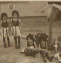
▲ Koziołek Matolek Zawędrował do Afryki, gdzie Murzynki o mato go nie zjadły... (przed-szkolacy z Lutyni Dolnej).