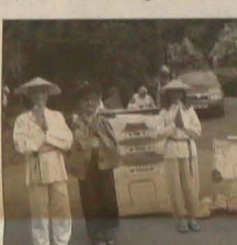
▲ Koziołek Matolek zawędrował do Chin, gdzie cesarz starał się go nauczyć chińskiego abecadła. Chińczyków przedstawiała dzieci z Bogumina.