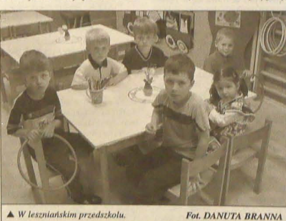
W lesznieńskim przedszkolu.