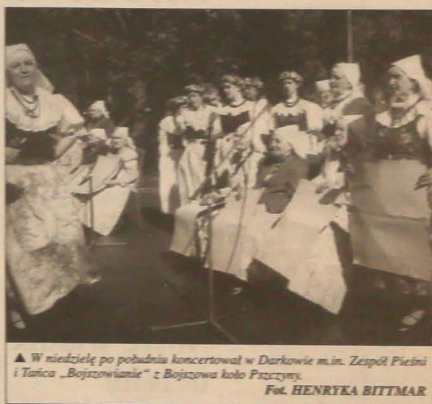
▲ W niedzielę po południu koncertował w Darkowie m.in. Zespół Piesni i Tańca „Bojzrowianie” z Bojzowa koło Przemysla.