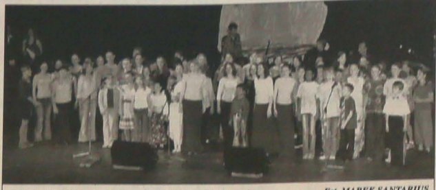
Uczestnicy VIII Festiwalu Piosenki Dziecięcej w Hawierzowie.

Nie opisywane materiały publicystyczne i informacyjne pochodzą z satelitarnej sieci informacyjnej Polskiej Agencji Prasowej.