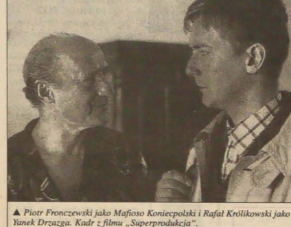
Juliusz Machulski.

W „Superprodukcji” śmieje się pan z całego środowiska filmowego: producentów, reżyserów, krytyków. Nie obawia się pan, że kolejni nie mają poczucia humoru i obrażą się na pana?