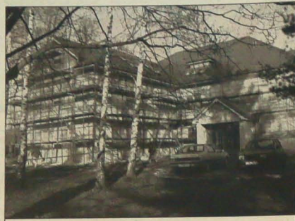
Zgodnie z zapowiedzią władz, Jablonkova wybudowana w tym samym roku gmach urzędu miejskiego jest obecnie w stadium finalizacji. Choćby nie mieszcząc biurowo oddano do użytku już w grudniu, wykonanie tylnych zewnętrznych części zostało zawieszony. Budowlany obowiązek jest bowiem, że niskie temperatury mogłyby zniszczyć ich pracę. Pierwsza warstwa tylnych jest już gotowa, a w przyszłym tygodniu, kiedy zaprawa „dojrzeje”, elewacja zostanie pokryta drugą - końcową - warstwą.

Nie sygnowane materiały publicystyczne i informacyjne pochodzą z satelitarnej sieci informacyjnego Polskiej Agencji Prasowej.