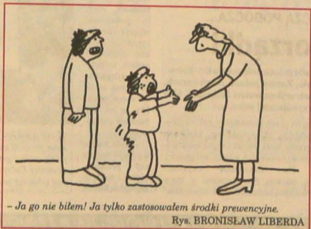
- Ja go nie biłem! Ja tylko zastosowałem środki prewencyjne. Rys. BRONISŁAW LIBERDA