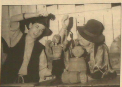
Zdjęcie z archiwum „GL” przedstawia scenę ze spektaklu „Nie” odegranego w marcu 1995.